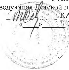
ГРАФИК обследования на гельминты детей посещающих ГБДОУ с февраля по апрель 2015 год.